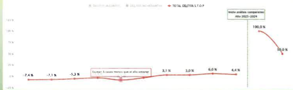
GRÁFICO DE EVOLUCIÓN PARA LOS DELITOS VIOLENTOS, NO VIOLENTOS Y TOTAL DELITOS S.T.O.P